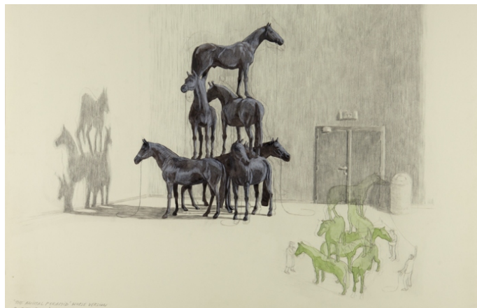
'The animal pyramid - horse version'. © Ruben Bellinkx