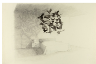
'The black sun - crow version'. © Ruben Bellinkx

Domesticatie en controle zijn thema's die dan ook vaak terugkeren bij Bellinkx. Zijn werken lijken haast semi-wetenschappelijke